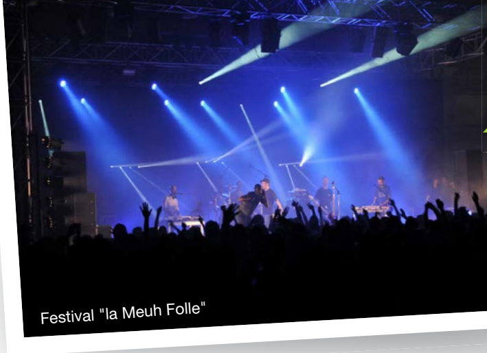
Festival "la Meuh Folle"